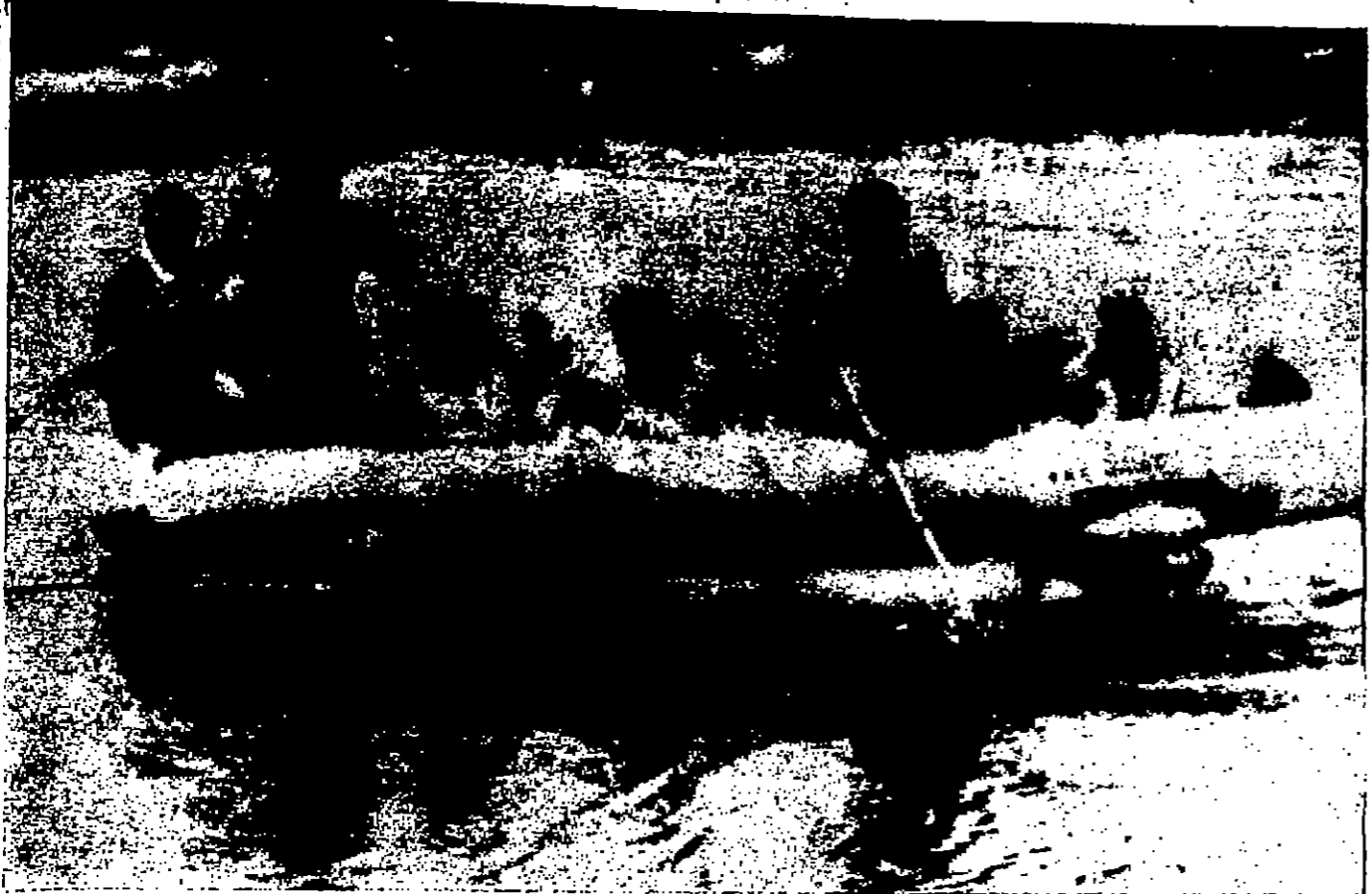
قارب انقاذ مملوء بملقاجين من الطائرة الفلبينية للتعاقب من نوع «دي سي ٨» اقصى هبطت هبوطاً اضطرارياً في خليج سان فرانسيسكو على بعد ميل واحد من مدرج المطار - وتحتاج جميع ركاب الطائرة وعددهم ١٧٧ ركاباً بالإضافة الى ملاحينها العشرة